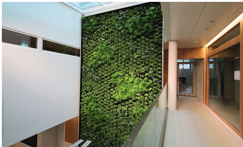
Neubau Raiffeisenbank in Altstadtliedenschaft in Solothurn.