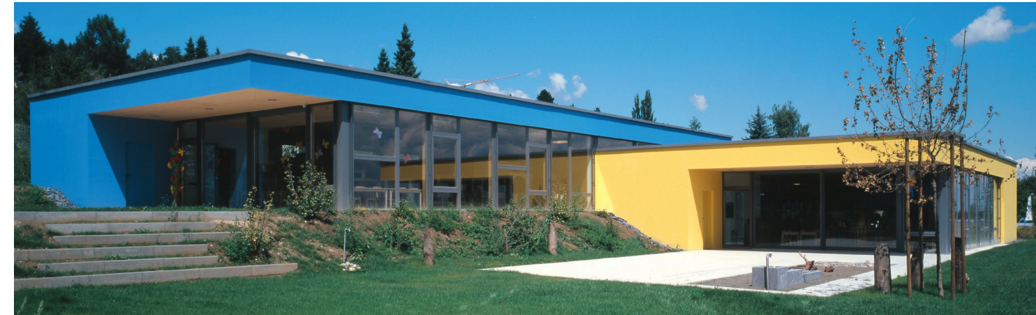
Neubau eines Doppelkindergartens in Lohn-Ammannsegg.