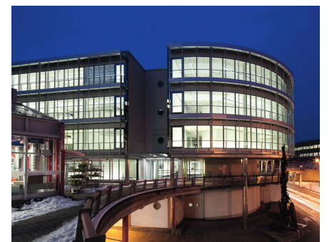
Gewerbebau Badenerstrasse 9 bis 13 in Brugg: Sanierung und Revitalisierung bestehender Gewerbebauten unter laufendem Betrieb.

serordentliche Herausforderungen geht. Und deshalb überlassen felber probst architekten auch bezüglich Berufsnachwuchs nichts dem Zufall: «Auf die Ausbildung von Lernenden sind wir besonders stolz. Wir sehen dies gleichsam als Verpflichtung wie als Investition in die Zukunft unseres Berufes.»