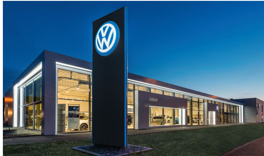
Die Neubauten der AMAG-Ausstellungshallen für die Marken VW, Audi, Seat und Skoda in Zuchwil sind ein Werk der felber probst architekten, Solothurn.

Die Wahrscheinlichkeit, mit felber probst architekten unbewusst schon Bekanntschaft gemacht zu haben, ist im Raum Solothurn sehr gross. Das belegt das Portfolio des vielseitigen Teams eindrücklich. Zahlreiche individuelle Wohn- und Gewerbebauten von privaten und öffentlichen Bauherren im näheren und weiteren Umfeld der Ambassadorsstadt tragen dessen «Handschrift». Ein Beispiel ist das Amthaus 2 in Solothurn, in welchem es die Umnutzung der Räume sowie die Ersetzung der Aufzugsanlage geplant, gestaltet und umgesetzt hat. Ein zweites von ganz vielen ist der Neubau der AMAG Solothurn an der Gewerbebrasse in Zuchwil. Hier verbindet sich zeitgemässe Architektur mit ansprechendem Ambiente und darüber hinaus trägt der von felber probst architekten gestaltete Bau ins-