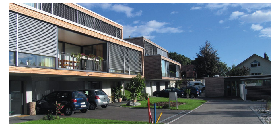
Neubau Siedlung Galmisbach in Rüttenen.